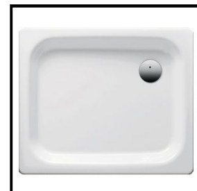
Duschwanne, Stahlblech, 90 x 90 x ca. 2,5 cm