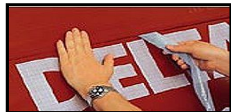
Unterspannbahn DELTA MAXX