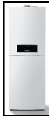
Therme und Speicher