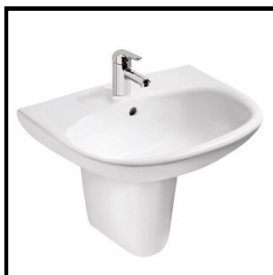
Handwaschbecken, Porzellan, halboval, 60 cm (Bad) (ohne abgebildete Halbsäule)