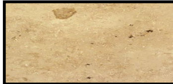
Innenfensterbank „Jura Gelb“