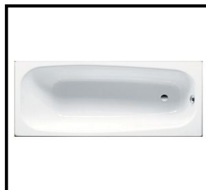
Badewanne, Stahlblech, 75 x 170 cm