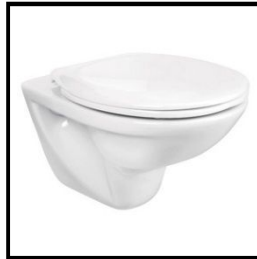
Wandhängendes Tiefspül-WC, Porzellan, inkl. WC-Sitz