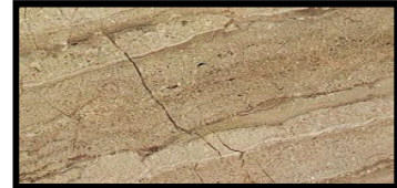
Innenfensterbank „Breccia Sarda“