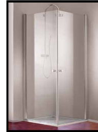
Duschtrennwand, Eckeinstieg, Glas