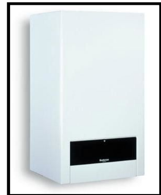
Durchlauferhitzer (Bedarfsposition entspr. Technischer Regeln)

Diese Bilder dienen lediglich der Darstellung der unterschiedlichen Möglichkeiten und stellen nicht die tatsächliche Ausführung dar.