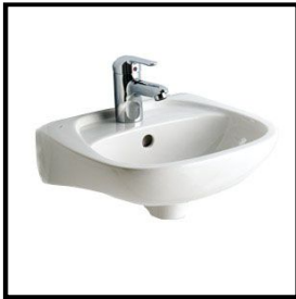
Handwaschbecken, Porzellan, halboval, 45 cm (Gäste-WC)