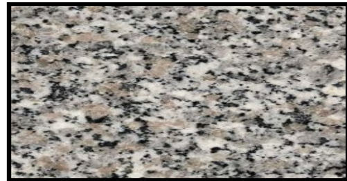
Außenfensterbank „Granit Rosa Beta“